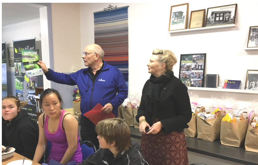
Efter fullgjord orientering fick eleverna pris (var sin innehållsrik kasse, bio-biljett och pizza!) för att Malås åk 9 varit bäst av alla nior i Västerbotten och Norrbotten i en tävling ordnad av skogs- och träindustrin.